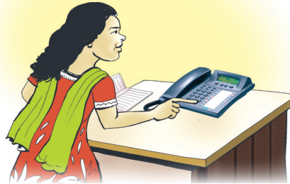
सम्बन्धित सहयोगी निकायलाई घटनाको बारेमा तत्काल फोनमा जानकारी गराऔं ।