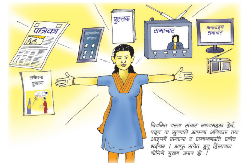
सामाजिक संजालको प्रयोग गरी सुसुचित होऔं ।

निश्चित पसल संसार नभयनहुन हेर्न, पढ्न वा सुन्नुको अपनको अधिकार तथा आदर्शको हानि तथा र सम्बन्धमाथि सचेत भई नसर् । आफु सचेत हुनु हिंसाबाट जोगिने मुख्य उपाय हो ।