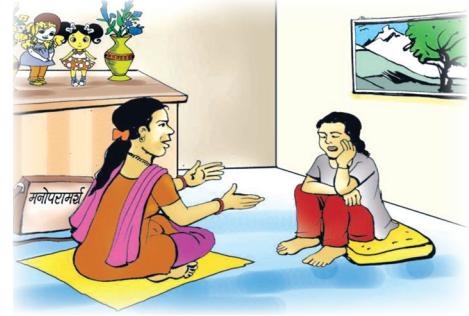
तालिम प्राप्त मनोविमर्शकर्तासँग मनोविमर्श सेवा लिऔं । सबैसेवा एकैस्थानबाट लिन ओसिएमसी जाऔं ।

महिला तथा किशोरी माथि हिंसा हुनु भनेको मानव अधिकारको हनन हो । हिंसा गर्नु र सहनु दुवै गलत हो । हिंसा सहेर नबसौं समयमै यसको प्रतिकार गरौं, समयमै सम्बन्धित निकायमा रिपोर्ट गरौं ।