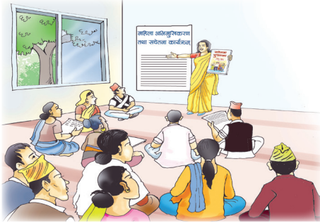
सचेतनामुलक कार्यक्रममा सहभागीता जनाऔं ।