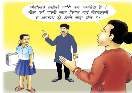
वालविवाह विरुद्ध आवाज उठाऔं ।