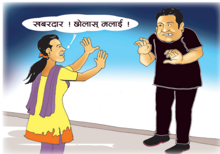
आफूमाथि भएका हिंसाको प्रतिकार गरौं । सहेर नबसौं ।