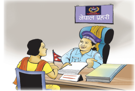
नजिकको प्रहरी कार्यालयमा गई घटनाको बारेमा उजुरी गरौं ।