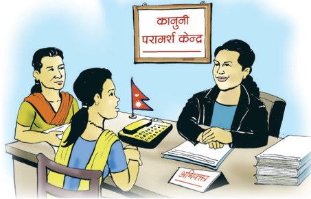
कानुनी परामर्श लिऔं । जिल्ला कानुनी सहायता केन्द्रमा यस्ता सेवा निशुल्क पाईन्छ ।